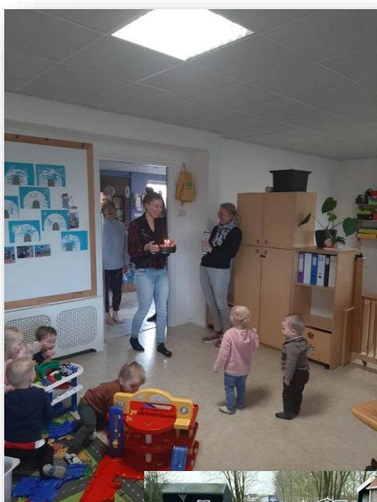
Foto impressie van de feestweek

Vanaf januari 2025 moet iedere pedagogisch medewerker in het bezit zijn van een erkend certificaat “Werken met baby’s”.